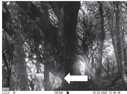
写真 2 撮影されたヤギ (矢印)