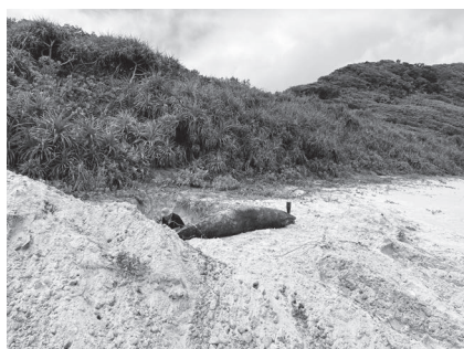
写真1. 船越海岸に打ち上げられた鯨

こうして調査を続けていると、奄美の海では研究だけでなく、思いがけない出来事にもよく出会います。鯨の解体から始まり、無人カヤックの通報まで、奄美でのフィールドはにぎやかです。それでも、こうした出来事も含めて、この島で研究する面白さなのだと感じています。