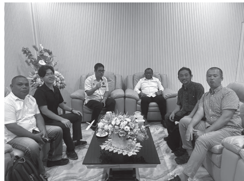
パティムラ大学での意見交換の様子