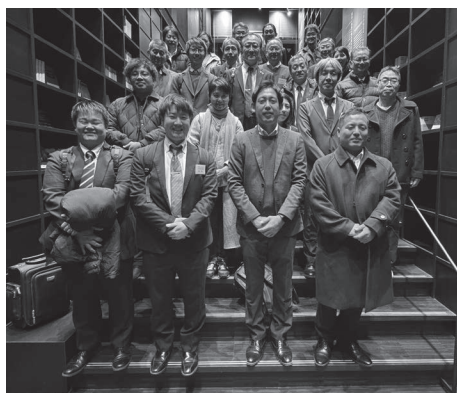
2024年12月17日ワークショップを終えて

奄美で以上のように数多くの教育研究活動が続けてきましたが、それらは奄美の方々の協力によって成し遂げられてきました。協力してくださる方は奄美に来た大学のスタッフについて知ることはあっても、鹿児島大学そのものについての知識は多くありません。鹿児島大学についてよく知ってもらうことは今後の相互交流に有益であろうということで、「鹿児島大学キャンパスワークショップ」として奄美の方を大学に招待して、大学を見学してもらい、意見交換会を開くことにしました。2024年12月17日～18日と2026年1月27日～28日の2回行いました。2回とも奄美から約10名、鹿児島大学スタッフが約30名参加し互いの活動を知ることができて、有意義な企画となりました。本プロジェクトは2027年度まであと2年間続きます。6年間のプロジェクトのまとめとなりますが、皆様のご協力をお願いいたします。