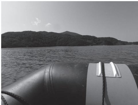
写真 1 枝手久島の遠景