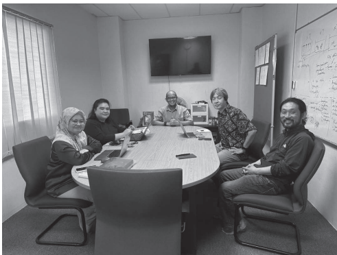
サバ大学での意見交換の様子