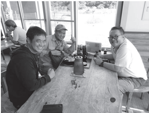
鹿児島に招聘された3大学の先生方