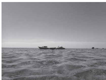
写真2. サンゴ調査に使用しているカヤック。潜っている間、海面には「空のカヤック」が浮かぶことになる。