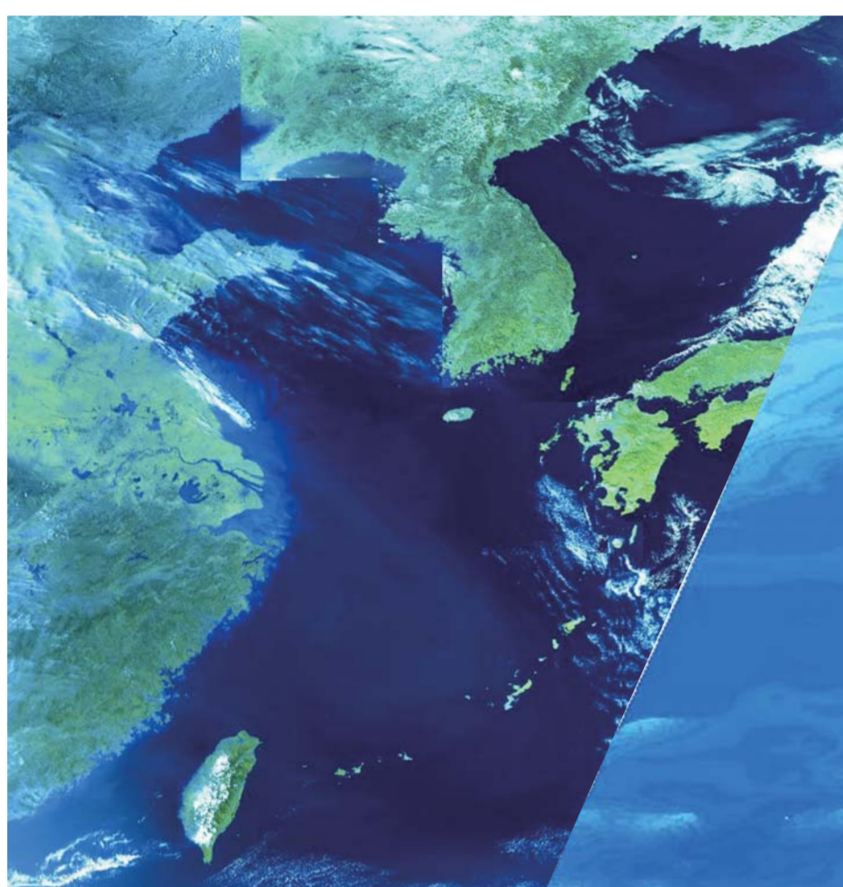
左: 鹿児島大学受信 NOAA/AVHRR 衛星画像 中: 海洋情報研究センター海底地形データ・国土 地理院数値標高データ・宇宙航空研究開発機 構提供ランドサットデータにより SIPSE グ ループ作製 右: Pacific ocean Floor, National Geographic Society 1992